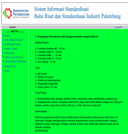
Gambar 2. Halaman Standar Uji Pada Analisis

Dari sekian banyak halaman atau menu yang telah dibuat yang menjadi inti sistem pada sistem informasi laboratorium standarisasi salah satunya adalah halaman standar uji. Halaman standar uji pada analisis adalah halaman yang memuat tentang standar pengujian parameter di laboratorium pengujian. Adapun yang ditampilkan adalah bahan kimia dan alat yang digunakan, cara kerja, serta hal-hal penting yang harus diketahui analisis. Antarmuka halaman standar uji pada analisis dapat dilihat pada Gambar 2 dibawah ini :