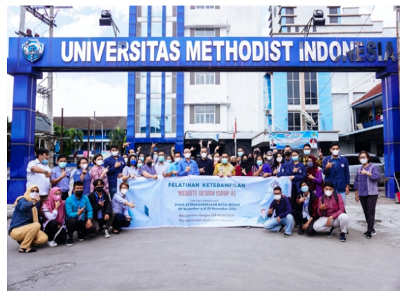
Gambar 5. Foto Bersama Seluruh Peserta, Tim PkM dan Mitra dengan Latar Belakang Kampus UMI