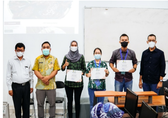
Gambar 4. Suasana Penyerahan Sertifikat Kepada Tiga Orang Peserta Terbaik

PkM. Evaluasi dilakukan pada hari terakhir PkM dengan ujian praktikum berbasis project. Berdasarkan hasil tes diperoleh informasi bahwa hampir semua peserta dapat mengerjakan project dengan nilai baik .