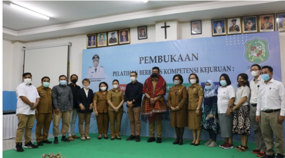
Gambar 2. Suasana Pembukaan PkM dan Foto Bersama dengan Mitra

Kegiatan ini dilakukan di Universitas Methodist Indonesia dari tanggal 9 sampai 25 November 2021. Kegiatan ini dibuka secara resmi oleh Walikota Medan Bobby Afif Nasution, S.E., M.M