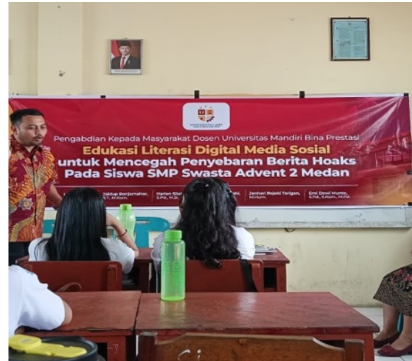
Gambar 2. Penyampaian Materi Edukasi Literasi Digital

Kegiatan selanjutnya dimulai dengan sosialisasi pemaparan edukasi literasi digital pencegahan berita hoax di media sosial. Pemaparan ini dilakukan durasi 30 menit dengan materi dan diskusi tanya jawab.