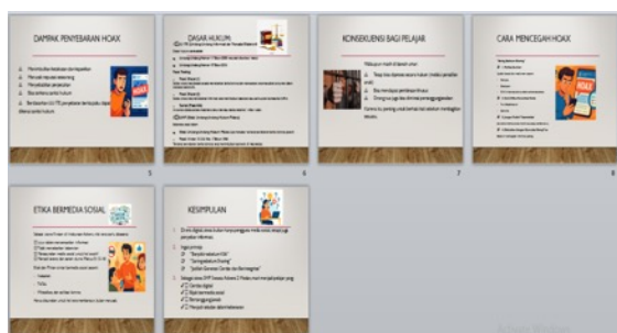
Gambar 4. Materi Pengabdian 2

Dalam penyampaian materi diatas tim pkm memberikan penjelasan tentang betapa pentingnya memahami literasi digital dalam penggunaan media sosial,dampak bagi mereka dan dasar dasar hukum yang telah tertuang di dalam undang undang ITE yang akan melindungi korban dan mengenakan sanksi bagi pelaku penyebaran hoax, dimana murid murid SMP sangat menyukai dan sesering mungkin membuka media sosial untuk sebagai menambah informasi penting bagi mereka. seperti pada materi ke 2 pada gambar3 di bawah ini: