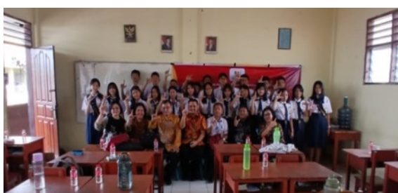
Gambar 5. Foto Bersama

Dari materi diatas narasumber memberikan penjelasan tentang cara mencegah berita berita hoax yang berswelioren di media sosial dimana kita harus bijak bermedia sosial dimana anak anak SMP harus mampu memfilter berita berita hoax yang ada di media sosial sehingga dalam bermedia sosial anak anak SMP sangat bijak dan mengurangi tindak kejahatan dan penyebaran hoax di media sosial. Akhir dari kegiatan sosialisasi penguatan literasi digital pada SMP Advent Medan dilakukan foto bersama dan penyerahan cenderamata sebagai ucapan tanda terimakasih persetujuan pelaksanaan penguatan edukasi literasi digital di SMP Advent Medan tersebut. Foto bersama dapat dilihat pada gambar 4 dibawah ini: