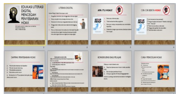
Gambar 3. Materi Pengabdian 1

Dalam penyampaian materi penguatan edukasi literasi digital dalam penyebaran berita hoaks pada sekolah SMP Advent dilaksanakan dengan memberikan materi dampak penyebaran berita hoaks , dasar dasar hukum , konsekuensi bagi pelajar dan bagaimana cara pencegahannya bagi pihak sekolah dan bagi anak anak usia remaja sehingga lebih memahamai bagaiman beretika bermedia sosial untuk kalangan remaja seperti point point yang di lampirkan pada beberapa slide persentase sosialisasi dapat dilihat pada materi 1 pada gambar2 dibawah ini :