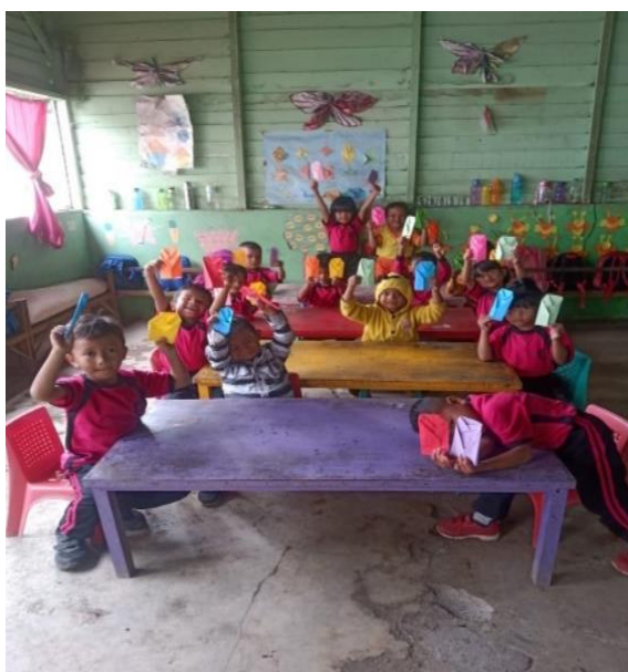
Gambar 3. Kegiatan Keterampilan Membuat Art & Craft

Pelaksanaan kegiatan kelompok 2 adalah kegiatan membuat art dan craft. Sebelum pelaksanaan kegiatan, tim pengabdian mempersiapkan alat dan bahan sebagai kegiatan pendukung. Kegiatan membuat art dan craft merupakan metode pembelajaran menyenangkan yang dapat melatih imajinasi dan kreativitas anak (Lorient et al., 2022). Manfaat dari kegiatan ini adalah melatih ketelitian dan kesabaran anak, peningkatan motorik dan melatih kepercayaan diri siswa. Gambar 3 menunjukkan kegembiraan dan semangat siswa melaksanakan kegiatan membuat art dan craft.