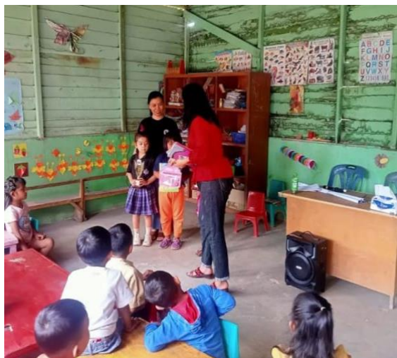
Gambar 6. Pembagian hadiah

Setelah kegiatan selesai, tim melakukan evaluasi kegiatan. Evaluasi dilakukan setelah pelaksanaan kegiatan yaitu sharing kepada orang tua siswa terkait perkembangan keterampilan anak setelah mengikuti kegiatan. Hasil evaluasi disimpulkan orang tua selama ini cenderung melarang anaknya banyak melakukan kegiatan-kegiatan yang menghabiskan energi anak. Orang tua belum mengetahui keterampilan anak. Orang tua juga menyampaikan bahwa anak mereka belum memiliki kepercayaan diri dalam mengembangkannya. Evaluasi siswa dilakukan dengan memperhatikan aktivitas siswa selama pelaksanaan kegiatan. Tabel 3 dibawah merupakan hasil rekapitulasi evaluasi anak. Indikator penilaian terdiri atas tujuh pernyataan yaitu: