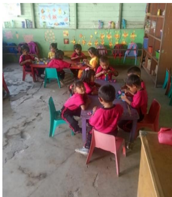
Gambar 2. Kegiatan Pembagian Kelompok Anak

Kegiatan keterampilan menyanyi dilakukan dengan antusias dan semangat dari siswa PG Paud Lae Lak Lak. Kegiatan bernyanyi memiliki manfaat meningkatkan kepercayaan diri anak, menambah kosa kata, membangun imajinasi dan banyak manfaat lainnya (Zendrato, 2019). Kegiatan pembagian kelompok dan bernyanyi dapat dilihat pada Gambar 2.