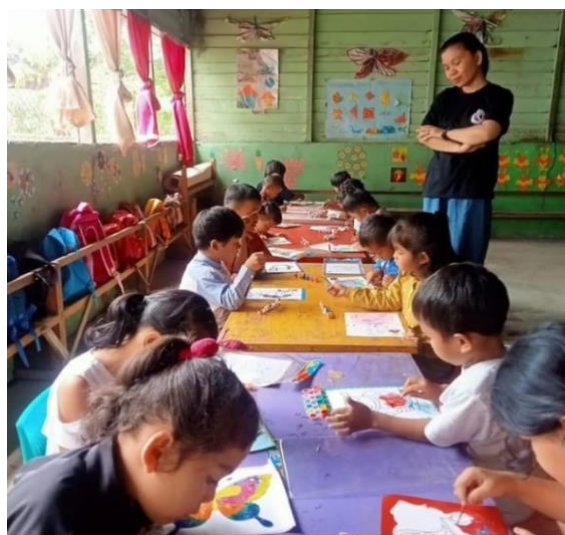
Gambar 5. Kegiatan Keterampilan Menggambar

Kelompok 4 melakukan kegiatan menggambar. Saat menggambar, siswa menggunakan imajinasinya untuk menciptakan bentuk yang diinginkan. Mereka terus berpikir kreatif dan menciptakan berbagai jenis gambar sesuai imajinasinya (Albariq et al., 2023). Jika hal ini dilakukan secara konsisten maka kreativitas anak akan terus terpacu. Gambar 5 menunjukkan aktivitas menggambar siswa.