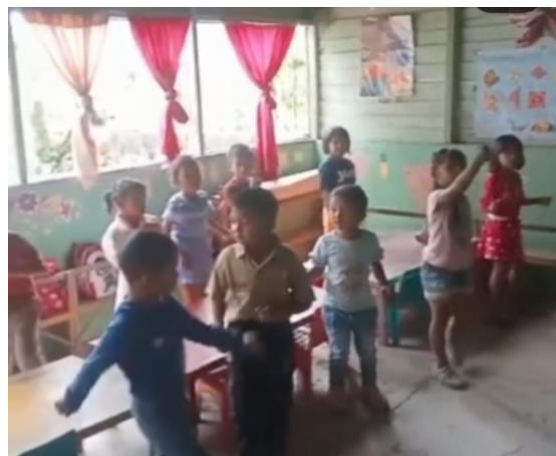
Gambar 4. Kegiatan Keterampilan Menari

Kelompok 3 melakukan kegiatan menari yang dipandu guru/tutor. Tarian mengikuti tampilan video lagu “Dihati ini ada Cinta”. Selama pelaksanaan kegiatan siswa sangat bergembira dan antusias untuk latihan. Kegiatan ini sangat bermanfaat bagi tumbuh kembang anak seperti anak dilatih menggerakkan tangan kiri, tangan kanan dan seluruh badan, mengurangi kekakuan tubuh. Menari dapat mengembangkan kecerdasan emosi, sosial (Sumanto, 2018). Gambar 3 menunjukkan siswa sedang latihan menari dengan penuh semangat dan bergembira.